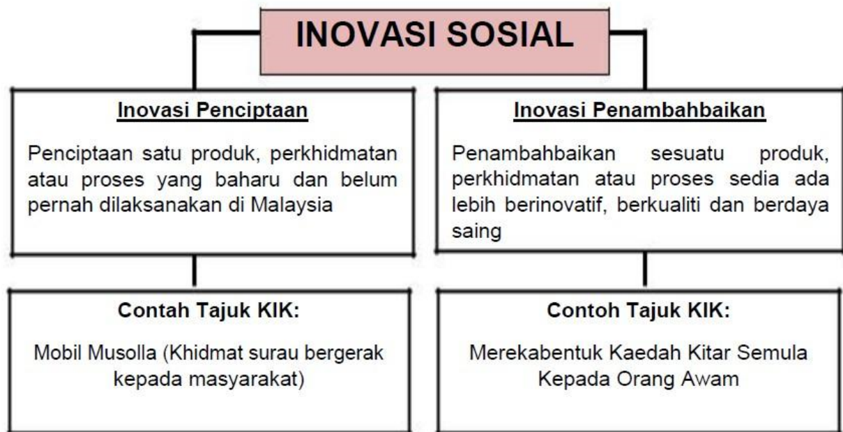
Rajah 1: Kategori bagi Bidang Inovasi Sosial dan Contoh Projek Yang Dihasilkan