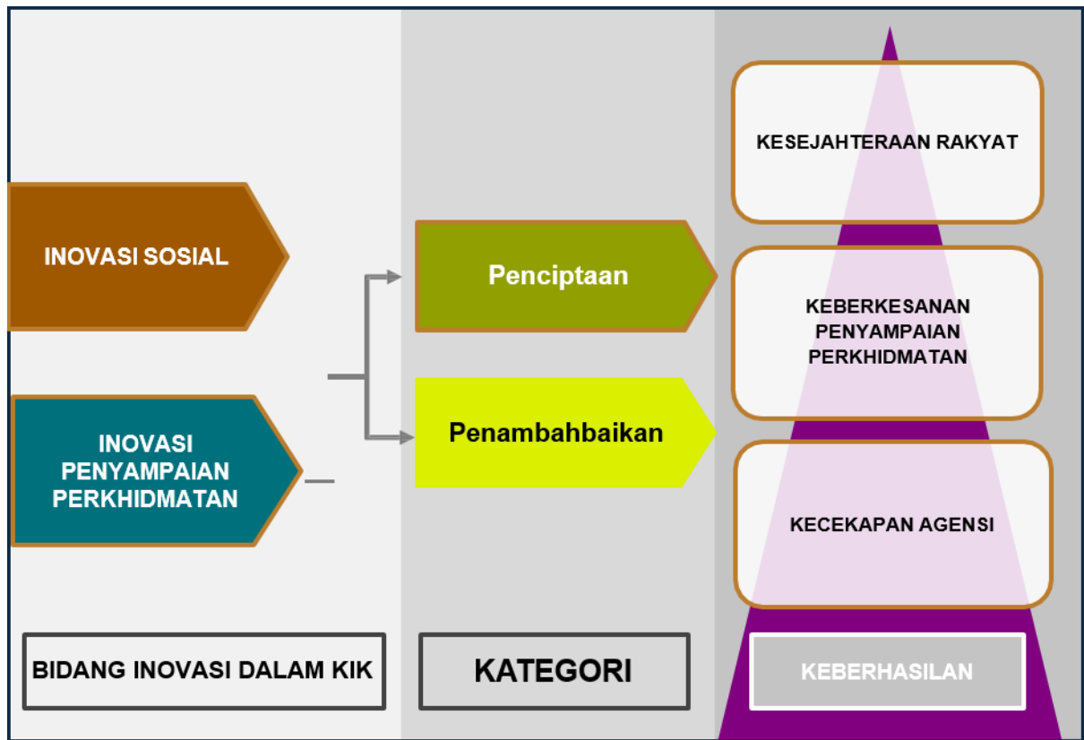
Rajah 3: Bidang Inovasi dalam KIK, Kategori Inovasi dan Tahap Keberhasilan